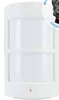
Détecteur de mouvement